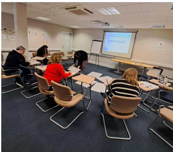
A helyi munkacsoport ülése Kellsben, Írországban