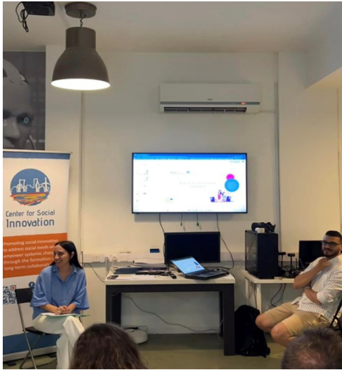
Szülői workshop Cipruson

A közösségi partnerségi találkozók mellett az LHF megszervezte első, kifejezetten a szülők számára szervezett workshopját. A digitális nevelési kompetenciamodell 1. kompetenciaterületére összpontosítva a workshop olyan érdekes témákat vizsgált, mint a deepfake technológia, az "ingyenes" online alkalmazások és a közösségi média algoritmusainak bonyolultsága. A szülők aktívan vettek részt az ösztönző eszmecsereken, megosztották tapasztalataikat és gondolatébresztő beszélgetésekbe kezdtek. A szervezők örömmel számoltak be arról, hogy a workshop felülmúlta a várakozásokat, és a résztvevők különösen értékelték a "tippeket és tapasztalatcsere lehetőségét", valamint a "rengeteg érdekes és hasznos tudást" amit a workshopokon kaptak.