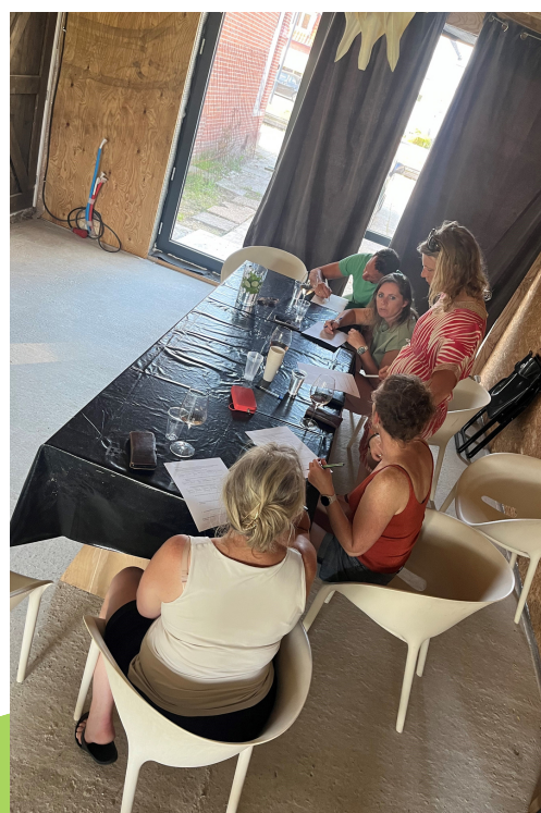
Szülői workshop Hollandiában

Az elmúlt néhány hónapban a hollandiai Learning Hub Friesland jelentős előrelépéseket tett a Digitális nevelés projektben. Két eredményes közösségi találkozót szervezett digitális nevelés témában, amelyeken elsősorban oktatási szervezetek vettek részt. Ezek a találkozók fórumként szolgáltak a szervezetekben folyó digitális műhelymunkákról, találkozókról és egyéb kezdeményezésekről, valamint a szülők által e tevékenységek során tett észrevételekről folytatott ösztönző megbeszélésekhez. A résztvevők mind szakmai szemszögből, mind pedig szülőként szerzett személyes tapasztalataikból kiindulva megosztották egymással meglátásaikat, gyakorlati és értékes információkkal látva el a szervezőket. Ezek a dinamikus partnerségi találkozók elősegítették az együttműködés kialakulását, kiemelve a digitális